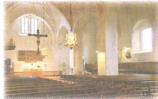
Kartanomatkat on tuotetaan uusia matkoja myös jo aikaisemmin tuttuihin Länsi-Suomen kartanoihin ja tulossa on ihan uusi matka Naantaliin. Yhtenä matkan kohteena on Naantalinen luostarikirkko.