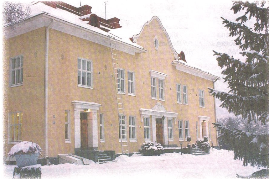
Hakhalan Kartano sijaitsee Hauholla ja on nyt mukana uudessa Kartanoelämän kirjossa Hämeessä -matkapaketissa.

jon ja Mathildedalin ruuikit Länsi-Suomessa, joihin Jokinen kävi tutustumassa viime keskuussa.