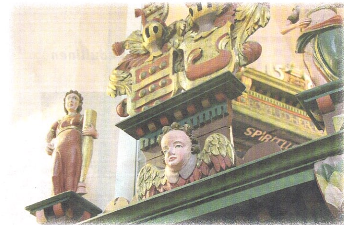
Naantalinen Luostarikirkon saarnustuolin veistoksia.

– Seili on kiinnostava kohte ja käytyni itse siellä muutama vuosi sitten halusin ottaa saaren myös omaan tuotantoon. Keväällä löysin yhteistyökumppanin, jonka kautta järjestävät laivamat-